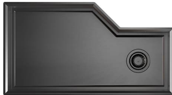
Évier Diade Gun Metal 3028 856